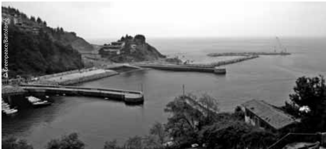
Mutrikuko portua zabaltzeko lanak.