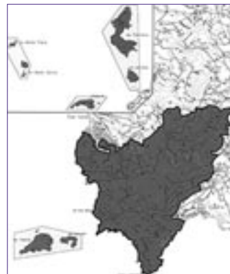
Àmbit actual del Parc Natural de Cala d'Hort