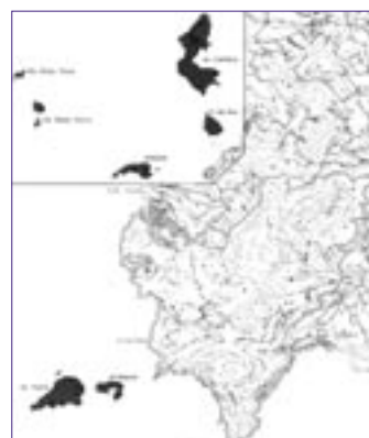
Proposta de "parc nou"