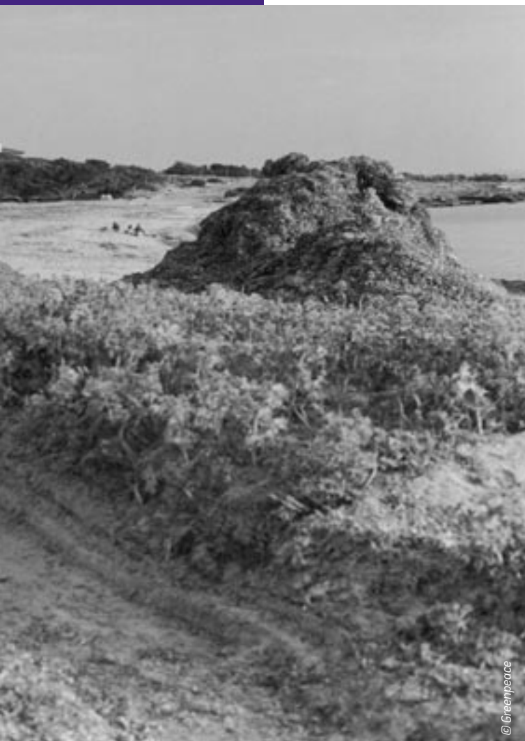
Platja del Caragol, Mallorca.

L'any passat ja va començar a intuir-se el canvi en les intervencions en el litoral. A la darrera de juliol, el Govern anuncià el començament dels tràmits per a reformar la Llei d'Espais Naturals per a permetre la construcció d'habitatges unifamiliars a les Àrees Naturals d'Espais d'Interès (ANEI) de les Pitiüses (Eivissa i Formentera), que permetia edificar un habitatge en una parcel·la de 5 hectàrees a les ANEI d'Eivissa i de 3 ha en el cas de Formentera, la qual cosa suposa la possibilitat de construir més de 6.000 xalets a les dues illes.