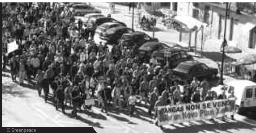
MANIFESTACIÓN VECINAL CONTRA EL PXOU DE CANGAS

Las promociones incorporan, además, campos de golf y puertos deportivos, como la planeada por Fadesa en Miño . La mayor transformación es la sufrida por la costa ártabra, donde se acumulan estas nuevas promociones. Foz y San Cosme de Barreiros , en Lugo, acumulan también un gran número de promociones en marcha.