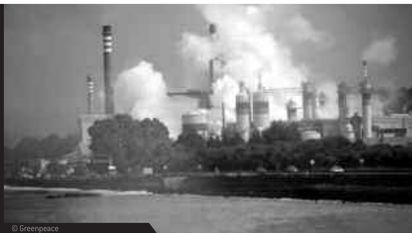
COMPLEJO INDUSTRIAL ENCE-ELNOSA EN LA RÍA DE PONTEVEDRA